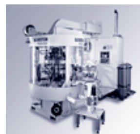
Multistar, der schnellste Schaltteller-Automat für Kleinteile

Der Bestellungseingang blieb zum vierten Mal in Folge auf dem ungenügenden Semesterniveau von CHF 40 – 45 Mio. Die Gründe liegen zum einen in der allgemeinen Baisse der Industrie für spanabhebende Werkzeugmaschinen, bei welcher der Bestellungseingang seit Anfang 2001 um 50% zurückging. Zum andern liegen sie bei den spezifischen Segmenten von Mikron, in welchen die Marktschwäche (zum Beispiel von Kugelschreibermaschinen) besonders ausgeprägt ist oder innovationsbedingte Investitionen (zum Beispiel Motorelemente und Einspritzsysteme) verzögert wurden. Einzig der Produktbereich Schneidwerkzeuge verzeichnete ein sehr starkes