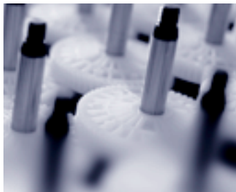
Millionenfach wiederholte Spritzgiesspräzision an jedem Standort der Welt

CHF 59,6 Mio. (Vorjahr CHF 57,0 Mio.) – unter Ausklammerung der erwähnten Produktionseinrichtungen (CHF 3 Mio.) – stabil, wobei die Volumen in Europa und Asien zulegen, in den USA zurückgingen.