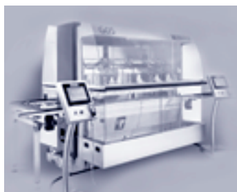
Hochleistung und Reaktionsschnelligkeit vereinigt in der neuen Generation von hochflexiblen Montagesystemen

Die Verkaufserlöse stiegen auf CHF 55,2 Mio. (Vorjahr CHF 44,7 Mio.) und sind eine Folge des guten Bestellungseingangs im Vorjahressemester. Das höhere Volumen und der gute Projektmix mit vielen Wiederholprojekten führten im 1. Semester zu einem sehr guten und im Vergleich zum Vorjahr wesentlich besseren Betriebsergebnis.