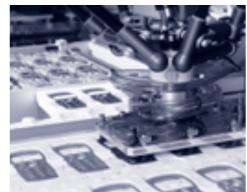
Einzelne Dienstleistungen (im Bild: Lackierung) oder komplette Prozesse für den Infocom-Kunden

Wie angestrebt konnte in Malaysia der Wegfall der mehrheitlich nach China verlagerten Produktion von Mobiltelefonkomponenten durch «Box-built»-Produkte mit Wireless-Technologie im Mobiltelefon- und Sicherheitssektor ersetzt werden. Auch entwickelten sich die Volumen für fertigmontierte Subsysteme von Digitalkameras erfreulich. Die Verkaufserlöse konnten