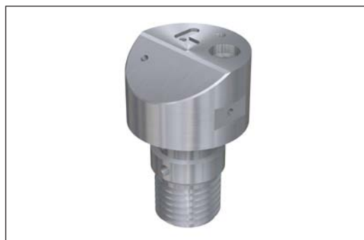
Componenti di dimensioni fino a 80x80x80mm o Ø65mm L100 possono essere lavorati efficacemente.