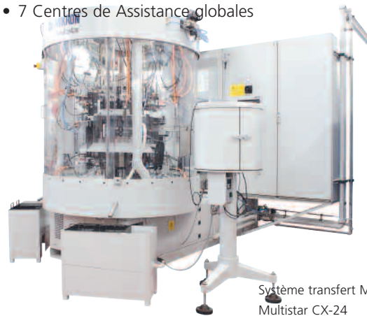
Système transfert Mikron Multistar CX-24