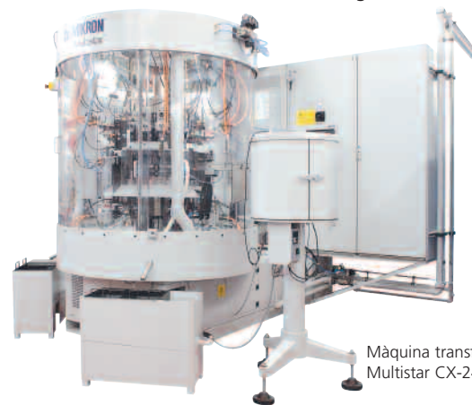
Máquina transfer Mikron Multistar CX-24