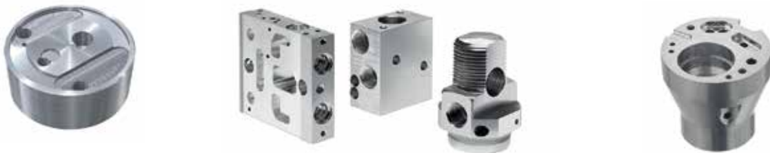
米克朗 NRG Plus 机床典型应用