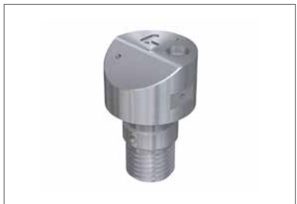
可有效加工的工件尺寸至 80x80x80mm 或 \varnothing 65\text{mm} \times 100\text{mm}