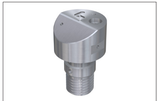
Bauteile mit einer Kantenlänge von bis zu 80x80x80mm oder Ø65mm L100 können nun effektiv produziert werden.